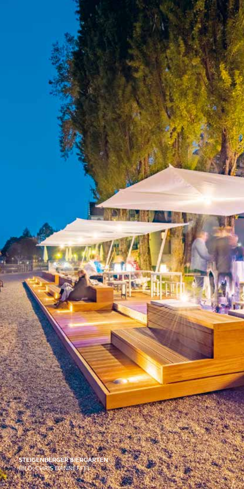
STEIGENBERGER BIERGARTEN

49 STEG 4 Restaurant, Café & Bar HAFENSTR. 8 78462 KONSTANZ STEG4.DE