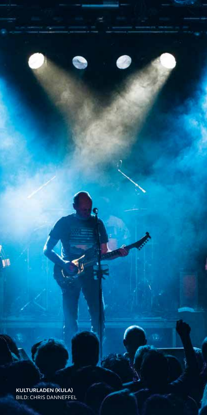
KULTURLADEN (KULA)