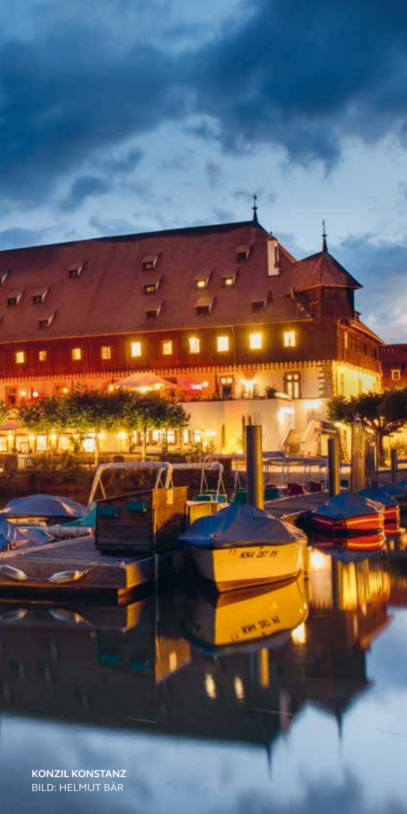
KONZIL KONSTANZ