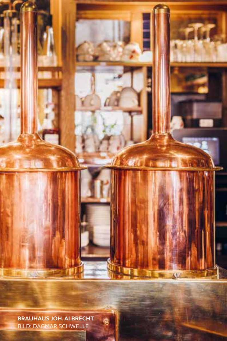
BRAUHAUS JOH. ALBRECHT