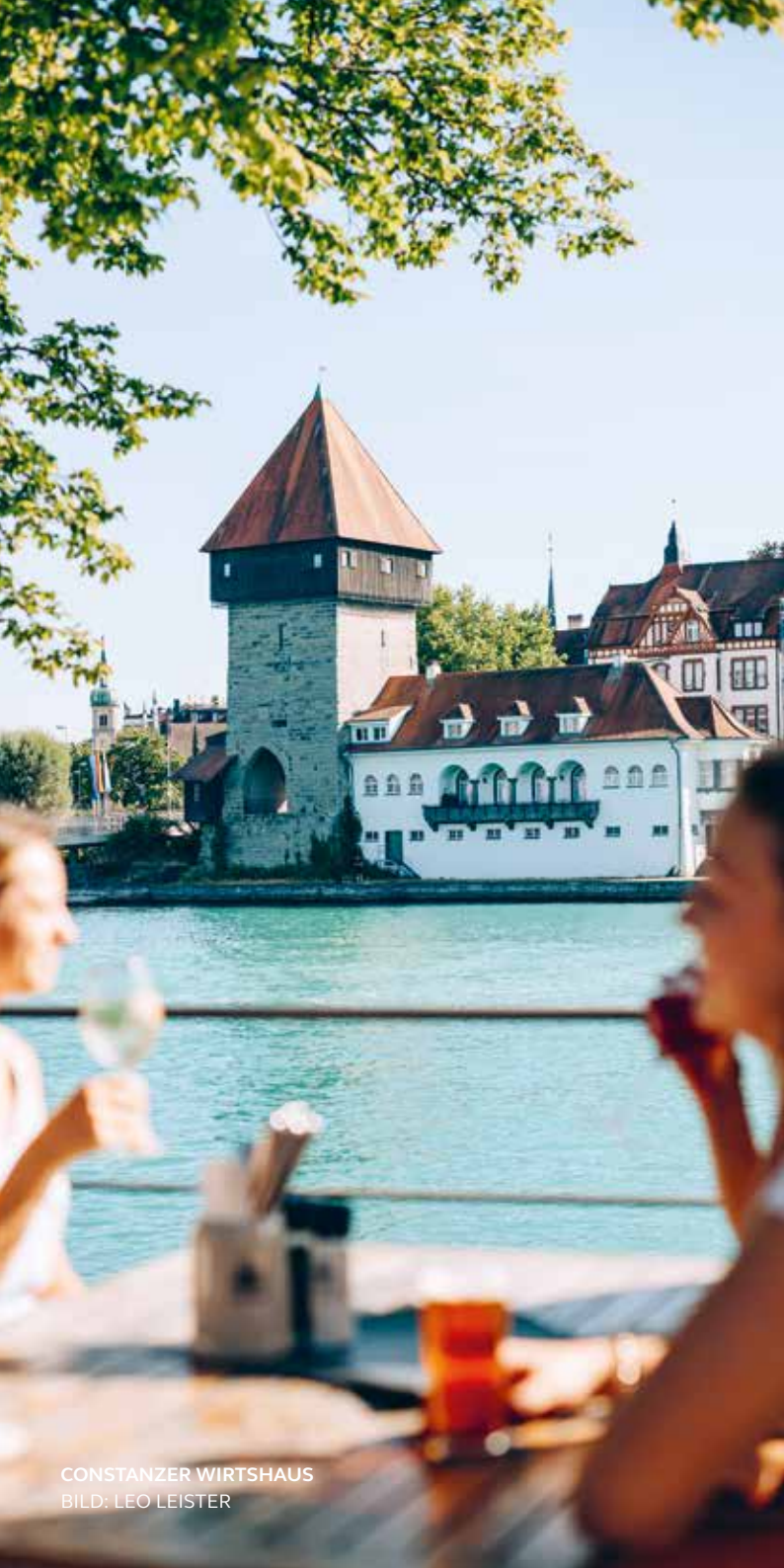
CONSTANZER WIRTSHAUS